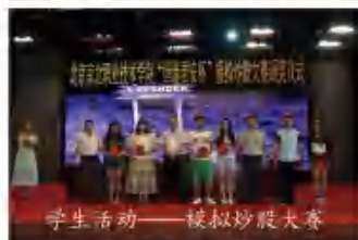
学生活动——模拟炒股大赛