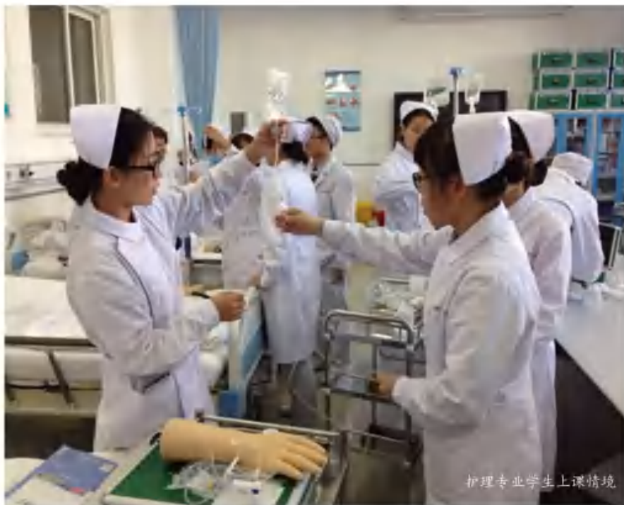
护理专业学生上课情境