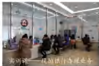
实训课——模拟银行专业业务

4、 校企协作形式多样： 学院已与怀柔区行政服务中心、京东、光大银行、建设银行、民生银行、国泰君安、华勤信会计师事务所等多家企业建立了校企协作关系。