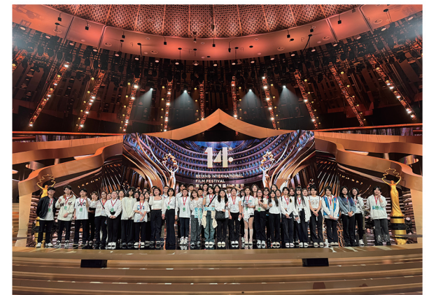
师生参加北京电影节