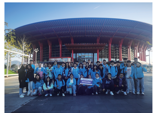
长城马拉松志愿服务