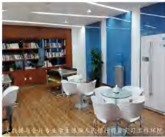
大数据与会计专业学生课下在人民银行自行自习工作环境