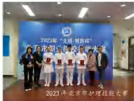
2023年北京市护理技能大赛

培养适应我国（医疗卫生事业）社会主义现代化建设和护理事业发展需要的，德智体美劳全面发展，掌握护理专业的基本理论知识和专业技能，具有良好的职业道德、人文素养、实践能力和创新精神，能胜任护理工作岗位的（毕业后能在各级医疗、预防、保健机构从事临床护理、社区护理和健康保健等护理工作的）高等技术应用型护理专门人才。