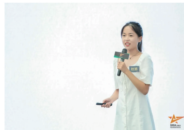
学生参加行业大赛竞演现场