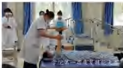
学院第一批康复技能

毕业后可在医院、康复中心、社区服务中心、残联、特殊教育学校、福利机构、运动队从事康复技术服务和管理工作。