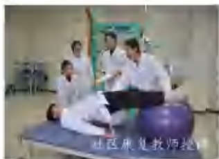
社区康复教师授课

本专业秉承“以需求为导向，以服务建专业，以爱心促健康”的培养理念，培养适应经济发展与建设需要的、德、智、体、美、劳全面发展的具有较高职业道德素养，较强的康复护理、保健、福利机构经营及管理能力的掌握扎实的康复知识的高等技术应用性专门人才。