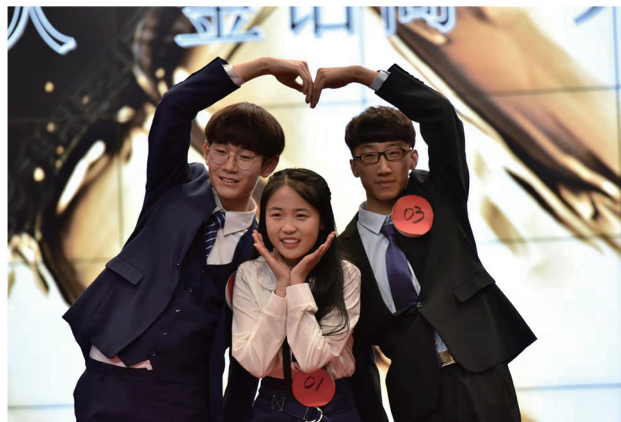
“金话筒”主持人大赛