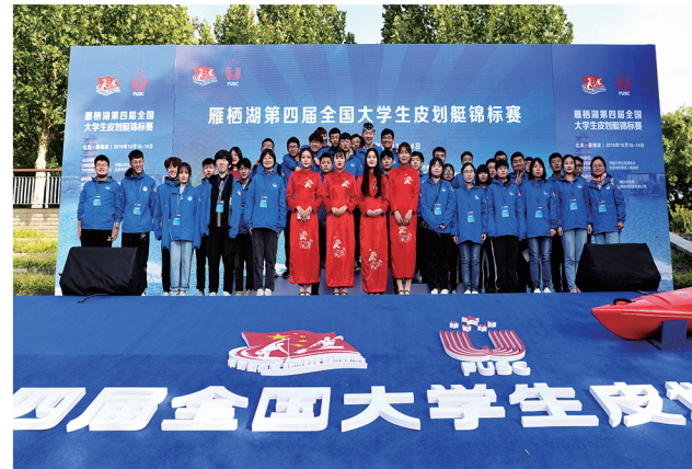
服务皮划艇锦标赛