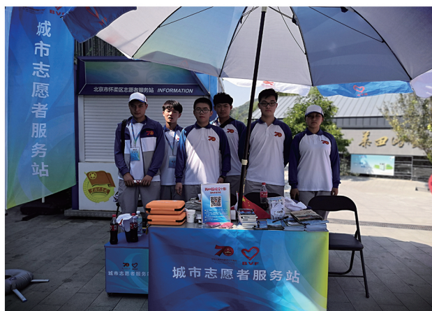
服务建国70周年-城市志愿者